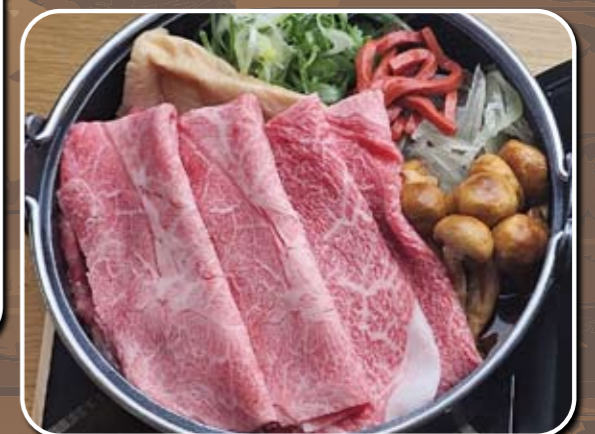
⑭みすじ 3,500円 (税込)