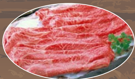
⑫赤身 2,750円 (税込)