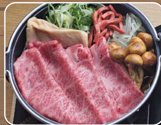
⑬ロース 4,500円 (税込)

自家製割下でお客様ご自身が炊き上げるすき焼きです。 多彩な具材と自社牧場産だいきち近江牛をお楽しみください。