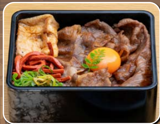
⑩ロース 3,500円 (税込)