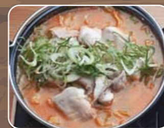
⑯赤 2,500円 (税込)