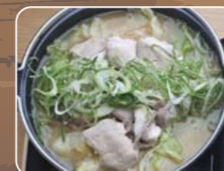
⑮白 2,500円 (税込)

自社牧場産だから鮮度抜群。 甘みと旨味の強いプリプリの ホルモンで、白味噌ベースの 自家製スープで煮込んでお楽 しみください。