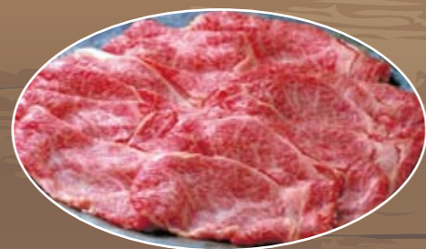
⑨ロース1.5倍 4,500円 (税込)